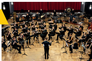
Landesflötenorchester Argentum

Samstag, 31.05.2024 14:00 Uhr Congress Centrum Ulm