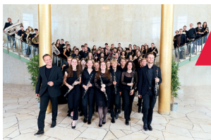
LJBO Hessen