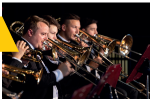
Kreisverbandsjugendblasorchester Ulm/Alb-Donau

Donnerstag, 29.05.2025 14:00 Uhr, Congress Centrum Ulm