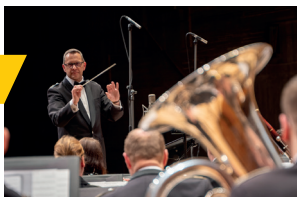
Musikkorps der Bundeswehr

Freitag, 30.05.2025 19:30 Uhr Congress Centrum Ulm