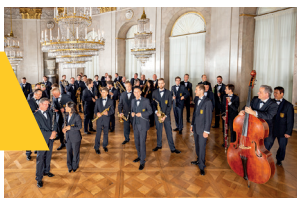
Landespolizeiiorchester BW

Sonntag, 01.06.2025 11:00 Uhr Congress Centrum Ulm