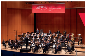
Junge Bläserphilharmonie Ulm