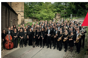
Landesblasorchester Baden-Württemberg