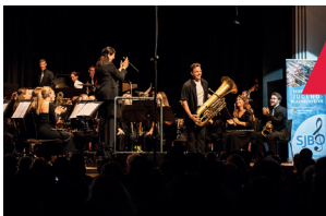
Schwäbisches Jugendblasorchester