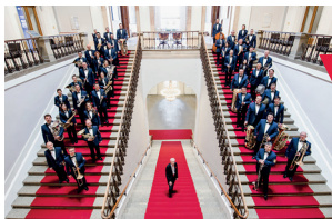
Polizeiorchester Bayern