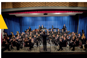
Rhein Hessische Bläserphilharmonie

Donnerstag, 29.05.2025 19:30 Pauluskirche Ulm